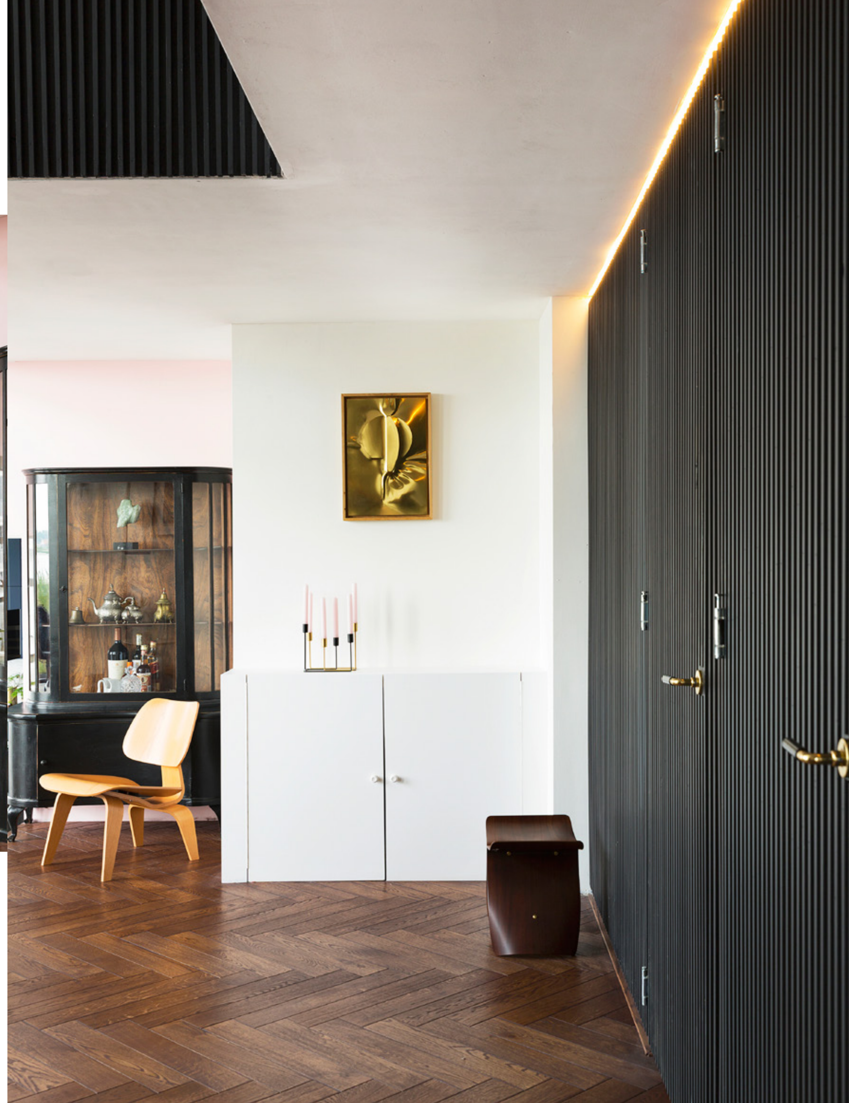
De wand tussen woonkamer en keuken – ‘de enige echte muur in huis’ – werd poederroze geverfd (vergelijkbare kleur is Middleton Pink van Farrow & Ball). RECHTS De klassieke buffetkast komt van Neef Louis. Ervoor een LCW Chair van Charles en Ray Eames, rechts een Butterfly Stool van Sori Yanagi (beide Vitra). Gouden kunstwerk van Susanne de Graef.